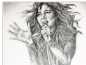
Рисуем человека. Ч.1. Для начинающих.