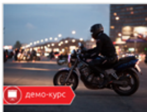
Устройство мотоцикла. Для демонстрации.