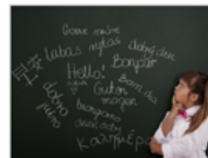
И-ский язык. От А до Я.