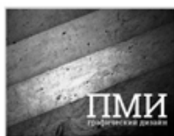
Первый Моршанский Институт