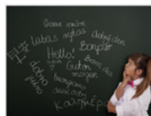
Н-ский язык. От А до Я.