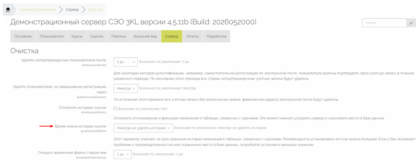
Рис. 2.2.1. Параметр «Время жизни истории оценок» на странице администрирования «Очистка».

Для настройки пользователь должен перейти по пути: Администрирование → Сервер → Очистка, и изменить значение параметра «Время жизни истории оценок» (Рис. 2.2.1). Параметр позволяет указать, сколько дней должна храниться история изменения оценок.