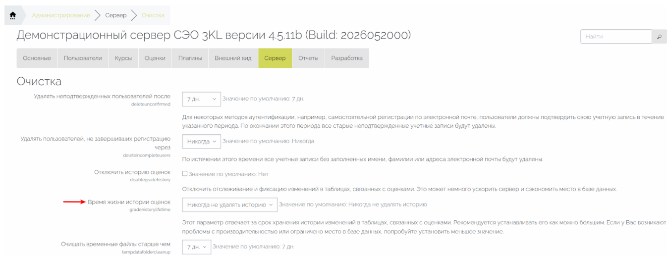
Рис. 2.2.1. Параметр «Время жизни истории оценок» на странице администрирования «Очистка».

Для настройки пользователь должен перейти по пути: Администрирование → Сервер → Очистка, и изменить значение параметра «Время жизни истории оценок» (Рис. 2.2.1). Параметр позволяет указать, сколько дней должна храниться история изменения оценок.