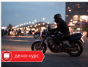
Устройство мотоцикла. Для демонстрации.