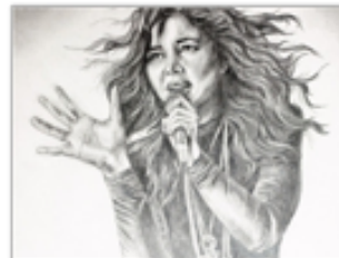
Рисуем человека. Ч.1. Для начинающих.