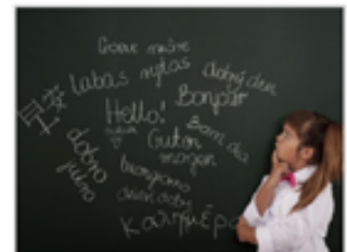
Н-ский язык. От А до Я.